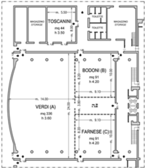
Piano -2 / Floor -2